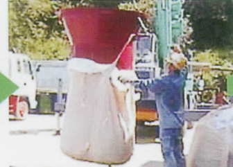
瞬作を移動して降ろし、瞬作からフレコンバッグを取り外す