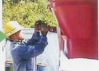
瞬作の楽に外せる治具でフレコンバッグを外し吊り上げて行程完了