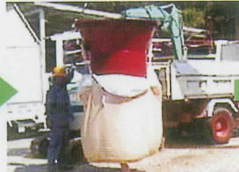
瞬作に土砂をバケツで入れ、吊り上げて移動する