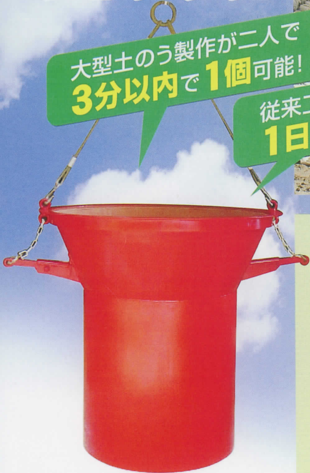
大型土のう製作治具「瞬作 シュンサク」