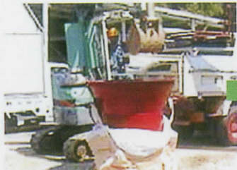
瞬作を吊り上げフレコンバッグを取り付け降ろす